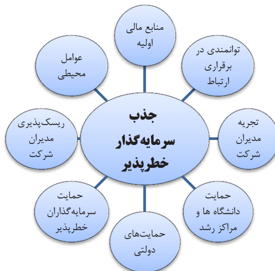
شکل ۱. مدل مفهومی تحقیق

با توجه به مبانی نظری مطروحه، مدل مفهومی تحقیق در شکل (۱) به تصویر کشیده شده است. همان‌گونه که در این مدل مشخص است، مجموعه‌ای از عوامل فیزیکی و محیطی و عوامل مرتبط با نحوه عملکرد مدیران شرکت‌های دانش‌بنیان، بر جذب سرمایه‌گذار خطرپذیر تأثیرگذار است. در این راستا، لازم به ذکر است در طراحی مدل این تحقیق، از مطالعه شهسواری و کرمی (۱۳۹۵) و والتر و همکاران ۱ (۲۰۰۶) بهره‌گیری و نهایتاً به شکل زیر ارائه شده است: